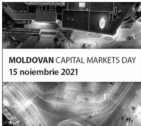
MOLDOVAN CAPITAL MARKETS DAY 15 noiembrie 2021

Bursa de Valori din Londra, în parteneriat cu Renaissance Capital și cea mai mare bancă din Moldova – MAIB, va organiza, în data de 15 noiembrie, „Moldova Capital Markets Day 2021”.