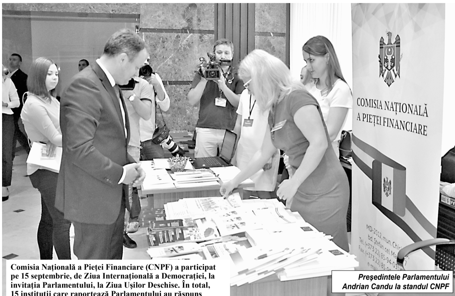
Președintele Parlamentului Andrian Candu la standul CNPF

Comisia Națională a Pieței Financiare (CNPF) a participat pe 15 septembrie, de Ziua Internațională a Democrației, la invitația Parlamentului, la Ziua Ușilor Deschise. În total, 15 instituții care raportează Parlamentului au răspuns invitației Legislativului de a participa la acțiunile de informare organizate de Ziua Internațională a Democrației. Este vorba de Serviciul de Informații și Securitate, Procuratura Generală, Comisia Electorală Centrală, Centrul Național Anticorupție, Banca Națională a Moldovei, Comisia Națională a Pieței Financiare, Curtea de Conturi, Consiliul Coordonator al Audiovizualului, Oficiul Avocatului Poporului, Autoritatea pentru Integritate, Agenția Națională pentru Reglementare în Energetică, Centrul Național pentru Protecția Datelor cu Caracter Personal și altele.