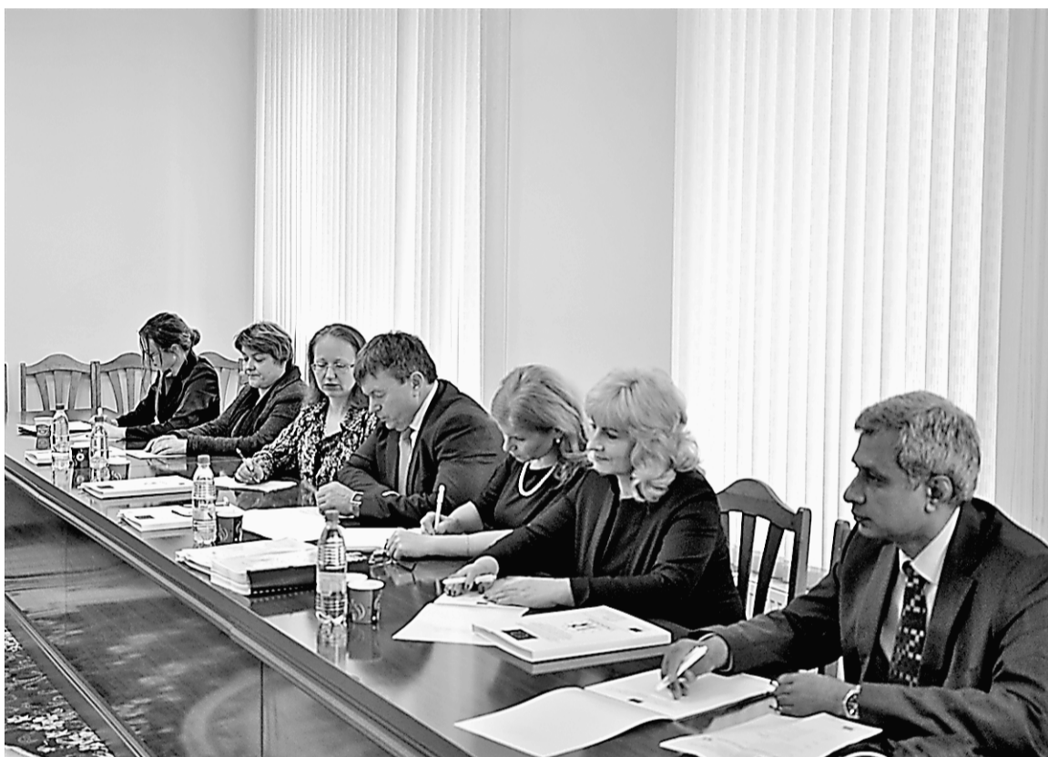
Представители ЕС и руководство НКФР подводят итоги последних трех месяцев работы проекта Twinning

Без преувеличения можно сказать, что за последние три месяца был изучен и представлен на обсуждение широкий круг тем и вопросов, таких как пере-