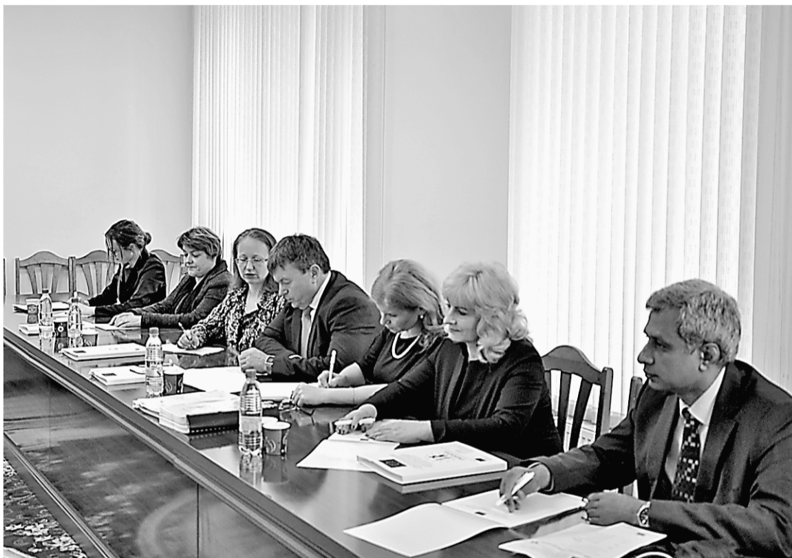
Reprezentanții UE și conducerea CNPF efectuează bilanțul activității în ultimele trei luni a proiectului Twinning

minată și pusă în discuție o arie vastă de teme și probleme, cum ar fi: revizuirea metodologiei privind inspecțiile în teren în sectorul asigurărilor; elaborarea metodologiei privind inspecțiile în teren și analiza din oficiu în sectorul pensiilor private; analiza din oficiu cu privire la prevenirea și combaterea spălării banilor și finanțării terorismului; evaluarea competențelor de supraveghere în domeniul pieței financiare nebancale cu privire la coope-