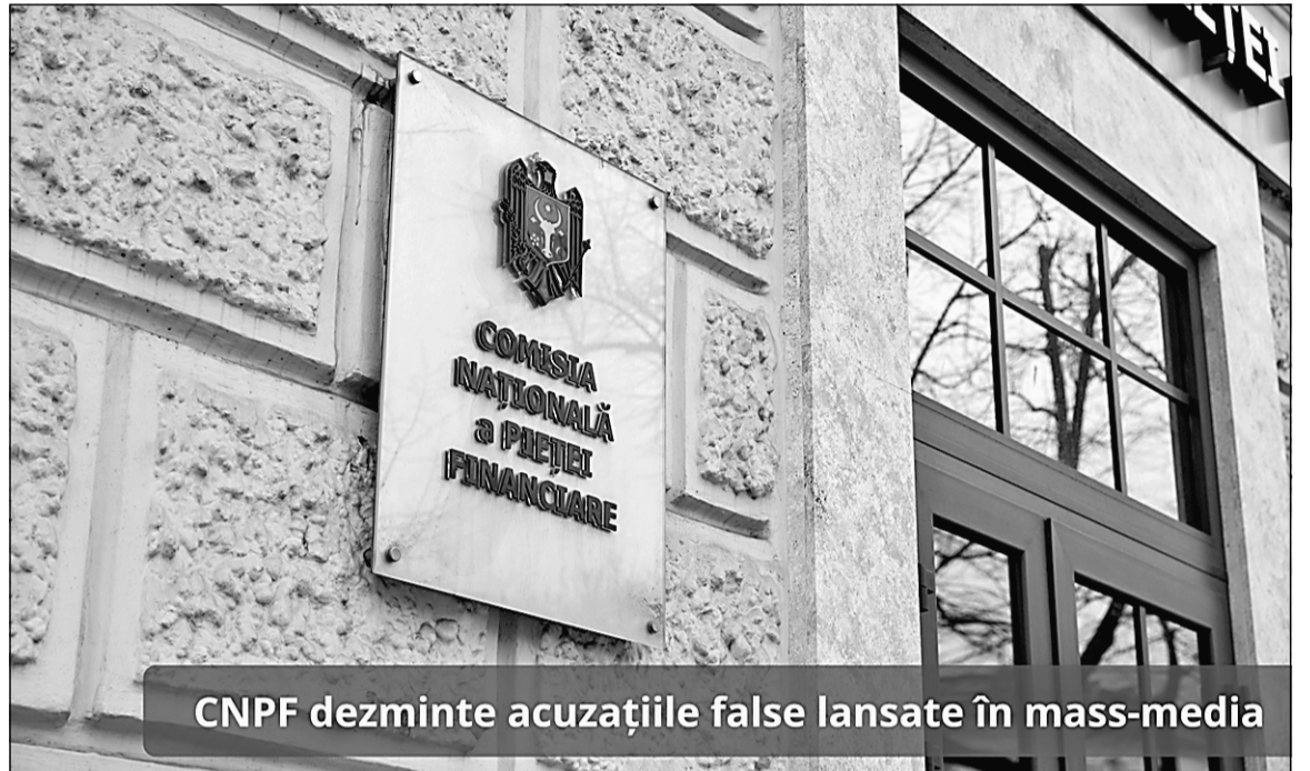
CNPF dezmente acuzațiile false lansate în mass-media

Cum CNPF a închis școlile („de educație financiară”)? Educația financiară nu este interzisă în Republica Moldova atunci când scopul urmărit al acesteia este creșterea nivelului de conștientizare a pieței de capital și instrumentelor financiare în rândul populației.