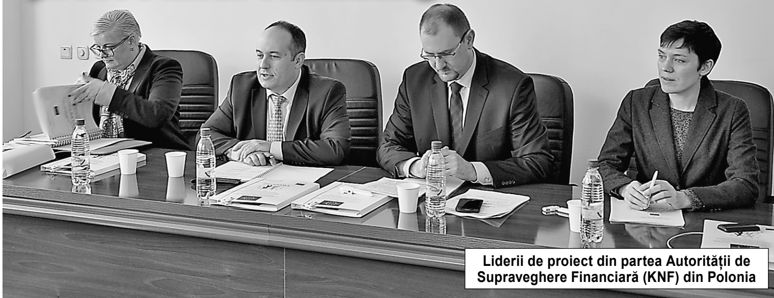
Liderii de proiect din partea Autorității de Supraveghere Financiară (KNF) din Polonia

Comisia Națională a Pieței Financiare a găzduit ieri un eveniment care, deși a devenit tradițional, de fiecare dată aduce informații noi, descoperă noi valențe și perspective pe care le oferă proiectul Twinning. Oficiali ai Uniunii Europene, lideri de proiect din partea Autorității de Supraveghere Financiară (KNF) din Polonia, precum și conducerea CNPF s-au întrunit pentru a se familiariza cu bilanțurile activităților realizate în trimestrul VI de la lansarea proiectului Twinning la Chișinău.