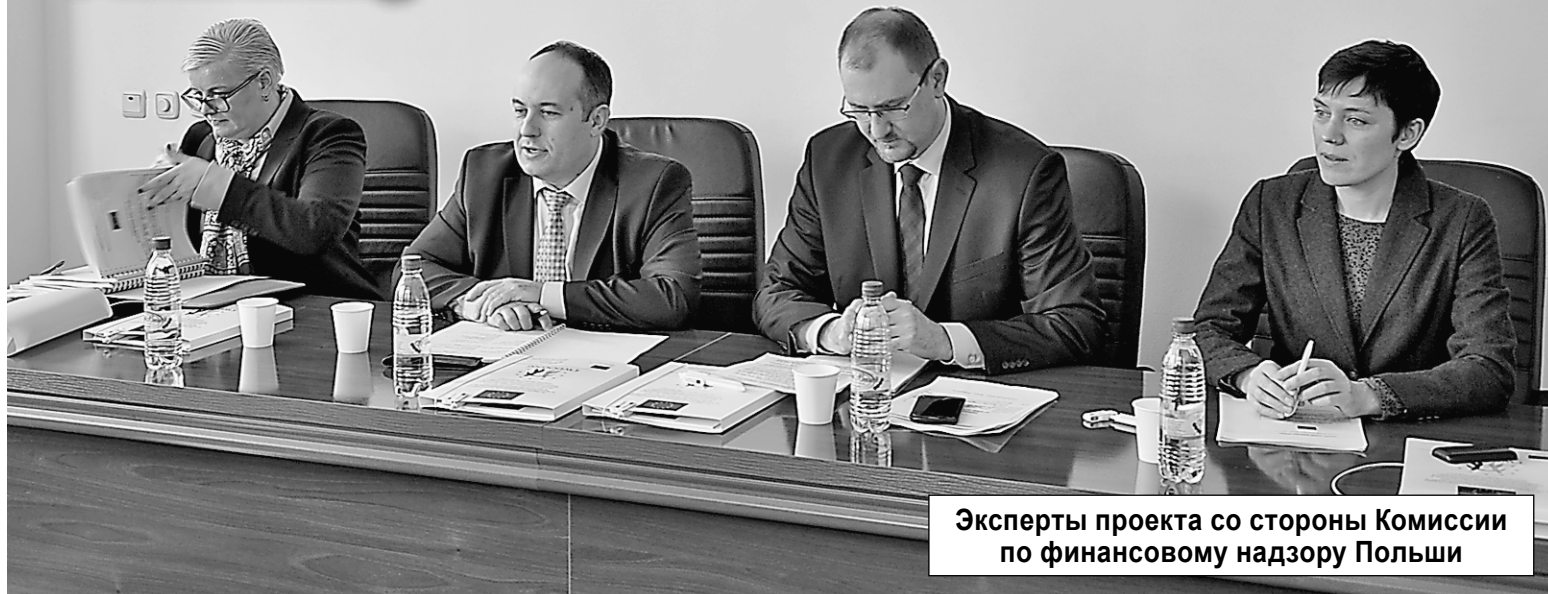
Эксперты проекта со стороны Комиссии по финансовому надзору Польши

Вчера Национальная комиссия по финансовому рынку провела уже ставшее традиционным мероприятие, где каждый раз появляется новая информация, открываются новые возможности и перспективы, предлагаемые проектом Twinning. Представители Европейского союза, лидеры проекта со стороны Комиссии по финансовому надзору Польши и руководство НКФР встретились, чтобы ознакомиться с итогами деятельности за VI квартал с момента начала работы проекта Twinning в Кишиневе.