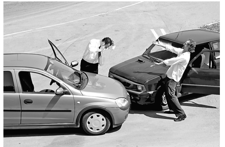
Конечная премия в зависимости от расходов страховщика и маржи прибыли

расходы страховщика, что означает все траты: содержание сети, офисов, вычислительной техники, отчисления брокерам, доля которых увеличилась с 25 до 40% в результате подорожания по всей цепи;