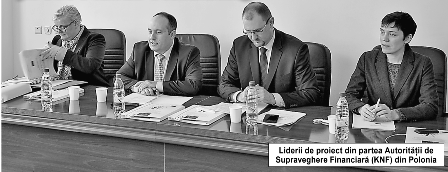
Liderii de proiect din partea Autorității de Supraveghere Financiară (KNF) din Polonia

Comisia Națională a Pieței Financiare a găzduit ieri un eveniment care, deși a devenit tradițional, de fiecare dată aduce informații noi, descoperă noi valențe și perspective pe care le oferă proiectul Twinning. Oficiali ai Uniunii Europene, lideri de proiect din partea Autorității de Supraveghere Financiară (KNF) din Polonia, precum și conducerea CNPF s-au întrunit pentru a se familiariza cu bilanțurile activităților realizate în trimestrul VI de la lansarea proiectului Twinning la Chișinău.