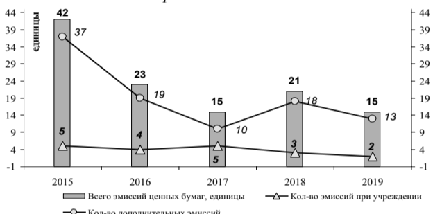
Таблица №1 Эмиссии ценных бумаг, зарегистрированных в Государственном реестре ценных бумаг (ГРЦБ) в июле 2019 г.